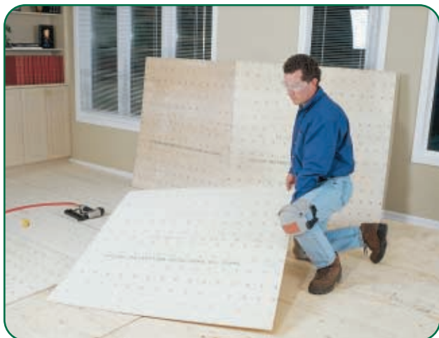
Placez et fixez les panneaux un à un.