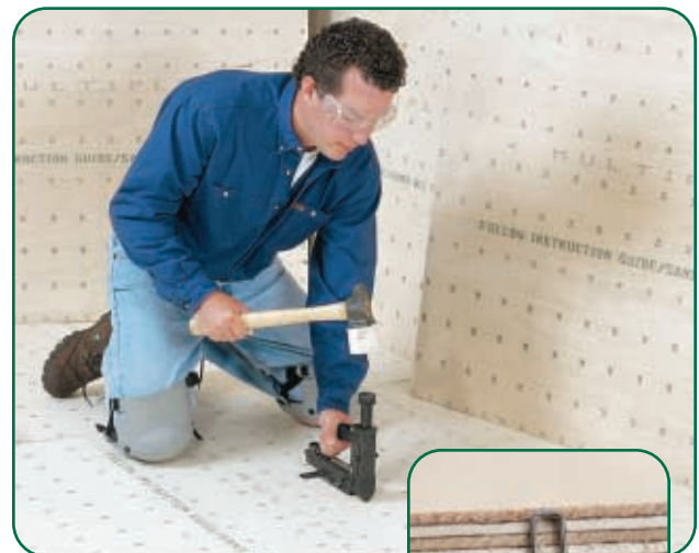
Enfoncez la tête des agrafes à 1/16 po et assurez-vous qu'elles traversent le faux-plancher à une profondeur de 75 à 90 %.