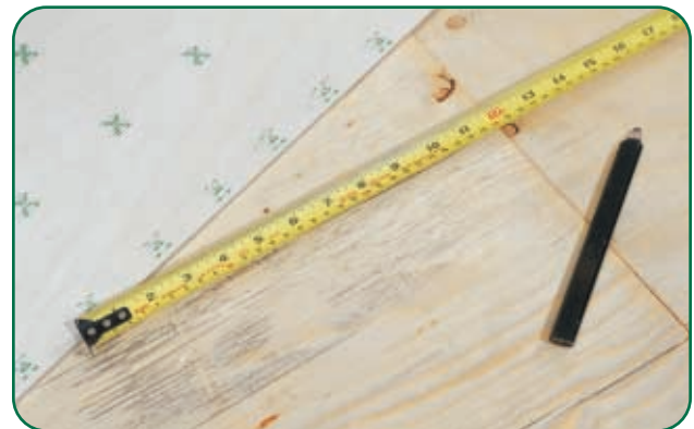
Décaler le bord de la sous-plancher Multiply d'au moins 12 po de celui du faux-plancher.